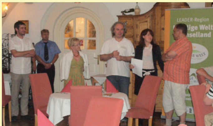
Susitikimas su Bucklige Welt vietos veiklos grupės nariais, Austrija