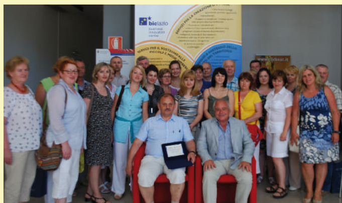
Tarptautinis seminaras, susitikimas su Italijoje veikiančios Gal Tuscia Romano vietos veiklos grupės atstovais