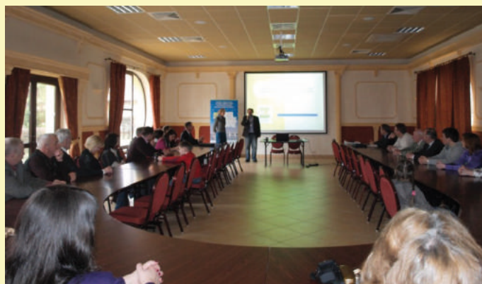
Susitikimas su partneriais iš vietos veiklos grupės „Didžiųjų Mozūrų ežerų zonos plėtros asociacijų sąjunga LGD9“, Lenkija