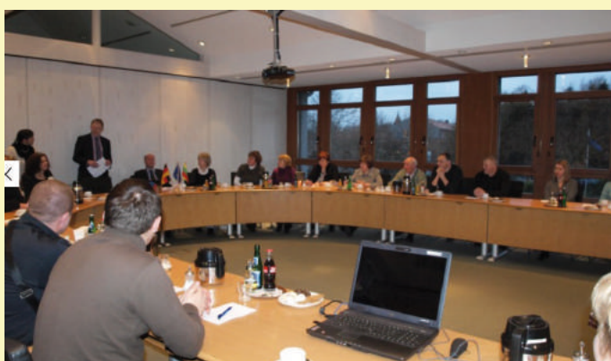
Susitikimas su Oldenburgo apskrities vietos veiklos grupės nariais, Vokietija