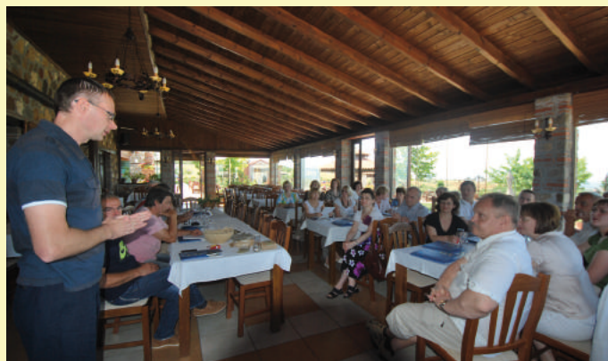
Šalčininkų rajono VVG narių ir pareiškėjų susitikimas su Graikijos VVG Aneth nariais