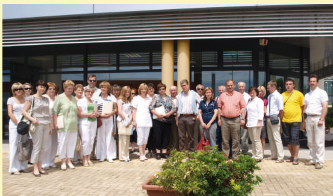
Susitikimas su MONTAGNA LEADER nariais Italijoje