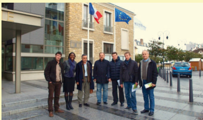
Tarptautinė konferencija ir susitikimas su Prancūzijos Ile-de-France regiono vietos veiklos grupės nariais